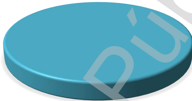
Gráfica 2 Cumplimiento de Actividades de Componentes Programas Presupuestarios 2021 (Porcentajes)